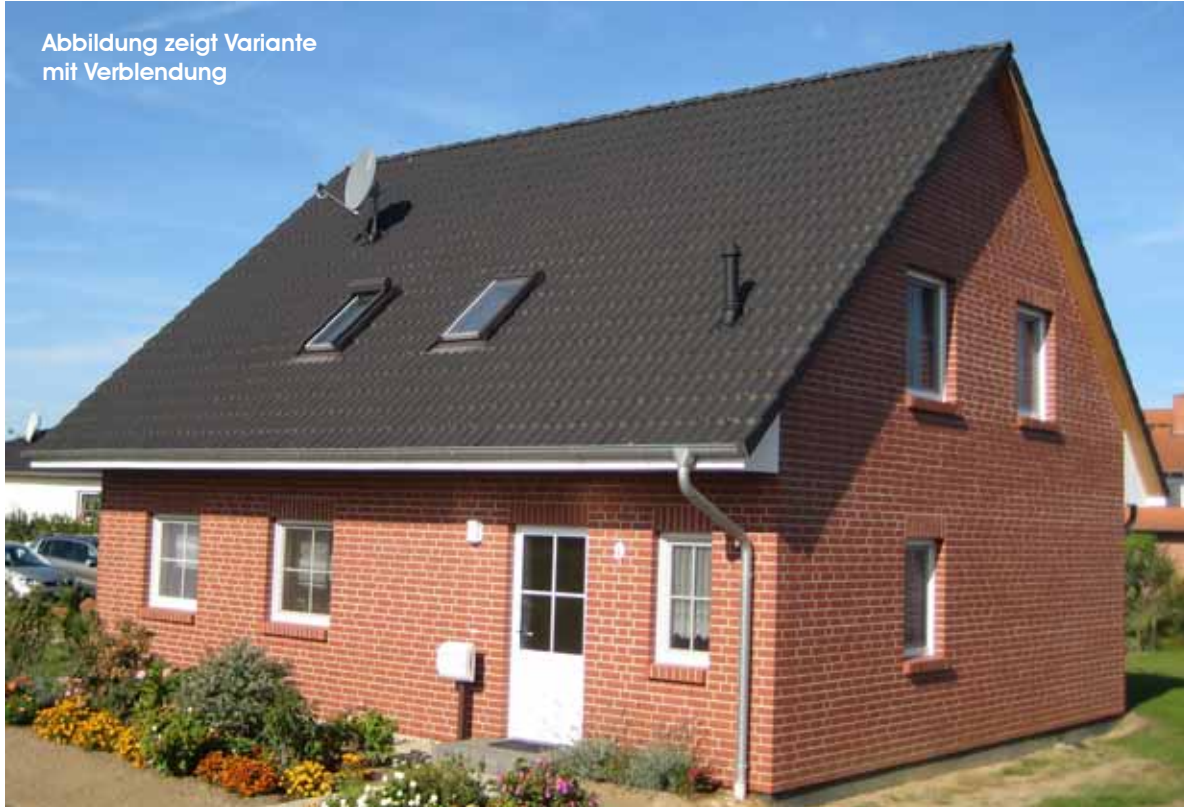
Abbildung zeigt Variante mit Verblendung

Ab Werk: 689 €/m 2 * Limitiert auf 10 Stück