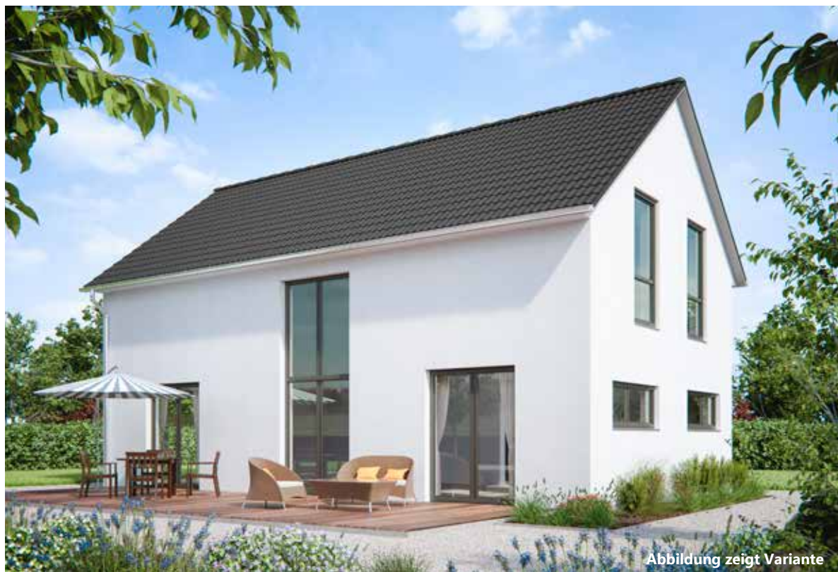
Abbildung zeigt Variante

Ihr führender Baupartner für individuelle Holzrahmen- häuser