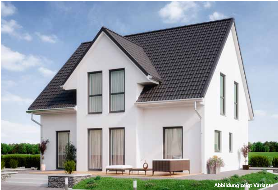
Abbildung zeigt Variante

Ihr führender Baupartner für individuelle Holzrahmen- häuser