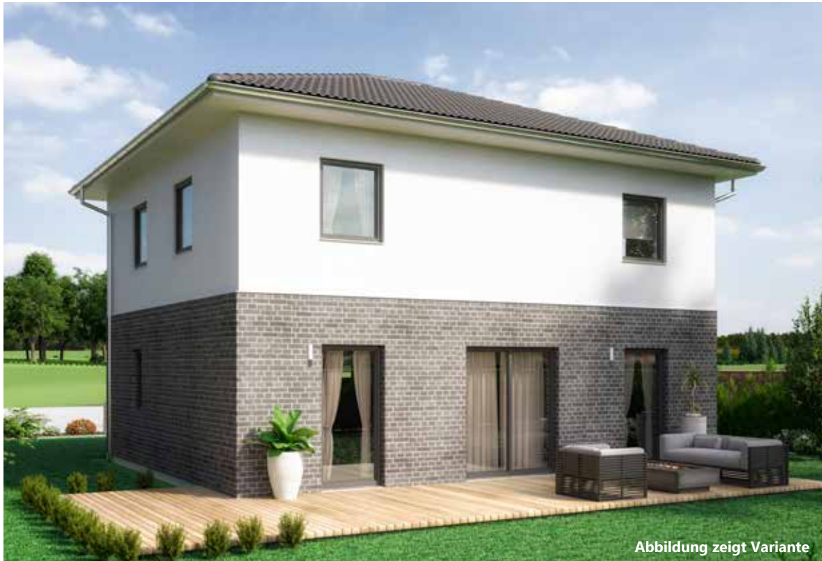
Abbildung zeigt Variante

Ihr führender Baupartner für individuelle Holzrahmen- häuser